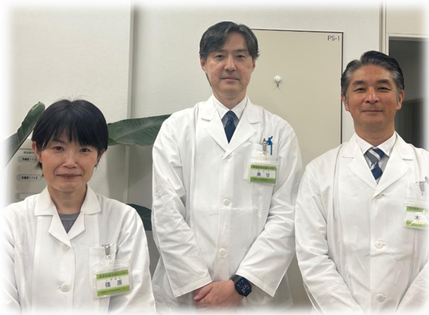
患者診療支援センター