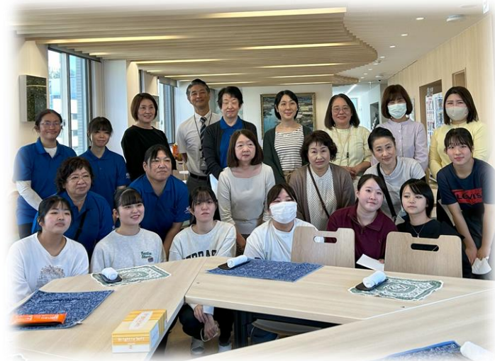
ワーキングチーム